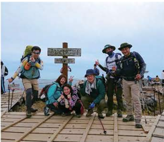
山頂は木道で歩きやすく360°の景観が楽しめる

今回ご紹介する山は、足を延ばして行きました日本百名山のひとつ「剣山」です。徳島県三好市東祖谷に位置する標高1,995mの山で、別名太郎笈と呼ばれ、南西側の次郎笈と対峙します。先に次郎笈に登って「剣山（太郎笈）」を正面に見ながら食べるおにぎりは最高です。一般的な登山口がある「見ノ越」