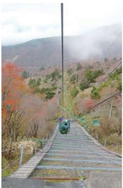
リフトでワープするもよし

フトで移動し、山頂でちょっと記念撮影なんて方が多いのも景観よし、利便性よしの「剣山」だからうなずけます。