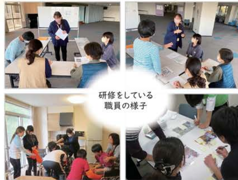
研修をしている職員の様子