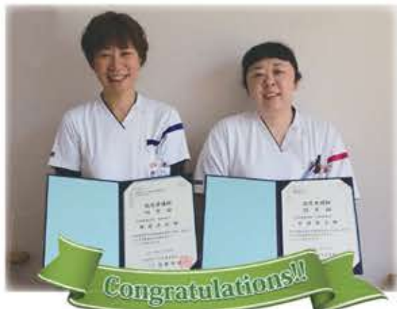
▲もみのき病院では、現在2名の認定看護師(緩和ケア・認知症看護)が在籍し、専門的なケアを実践しています。

これからも『その人らしく』過ごせるケアをできるだけタイムリーに対応し、多職種との連携を図っていくよう心掛けていきたいと思っています。また、緩和ケアを広く知ってもらうために、今後はグループ内での啓発活動や緩和ケアに関する勉強会などの指導や教育を行ない、患者さんやご家族だけでなく看護師からの相談などにも取り組んでいきたいと思っています。