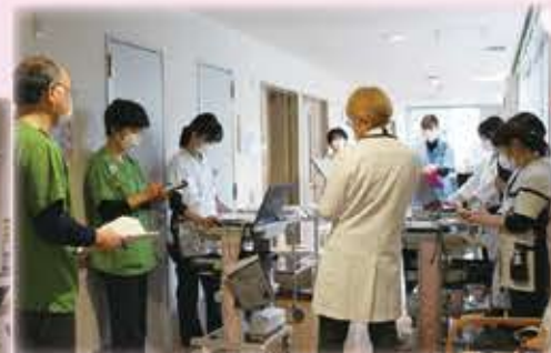
▲毎週木曜日に行なわれている緩和ケアチームカンファレンスの様子