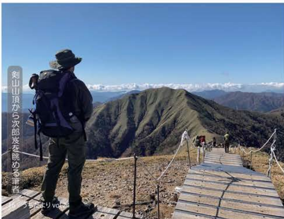
剣山山頂から次郎炭を眺める筆者