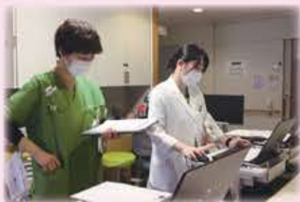
▲詰所では相談・情報共有を実践します