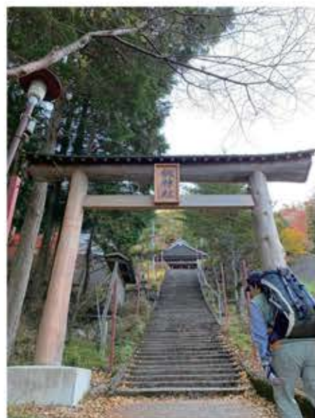
見ノ越からの登山口は「劔神社」から

1〜2か月に1度くらいの頻度で趣味を同じくする仲間たちと企画を進め、あちこちの山へとチャレンジするようになりました。その日のうちに帰ってこられる山登りが、私のスタイル。帰つてこられるなら、お隣の徳島県や愛媛県まで足を延ばすこともあります。