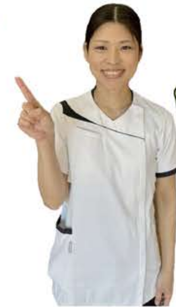
「美しい姿勢を意識した毎日を」の巻