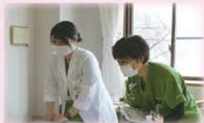
▲患者さんと接する際は笑顔で寄り添います

取得した現在では、緩和ケア病棟で勤務しながら、緩和ケア外来や緩和ケア面談、一般病棟の患者さんに対して緩和ケアチームのメンバーとして関わらせていただいています。緩和ケア認定看護師の役割とは、疾患を持つ患者さんやご家族に対して診断された時からトータル・ペインの視点でアセスメントを行ない、その人に適したケアを提供することです。患者さんとご家族が、『その人らしく』日常生活を送ることができるよう支援することを大切にしています。人には、それぞれの価値観やライフスタイルがあります。疾患からの症状や痛み・不安などのつらさがないか、患者さん・ご家族からお話を伺い、緩和ケア認定看護師としての専門的な知識や技術を活かして適切な対応ができるよう務めています。